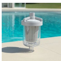
Piège à feuilles