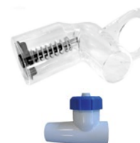
Dépresseur et vanne de réglage