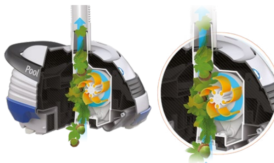
Technologie brevetée V Flex® : turbine à pales mobiles pour capturer les gros débris

Le design de ses ailes améliore l'aspiration de toutes sortes de débris.